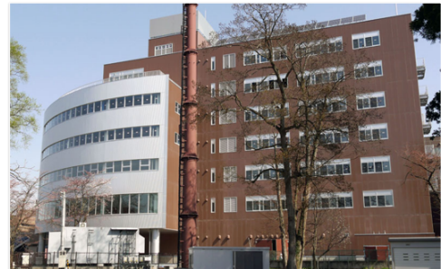
有機材料システムフロンティアセンター

TEL (0238)-26-3924 FAX (0238)-26-3412, E-mail: h-sasabe@yz.yamagata-u.ac.jp